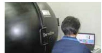
積分球による全光束測定