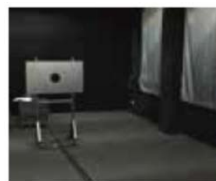
暗室での配光測定