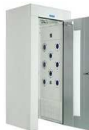
機器内、蛍光灯の置換えに最適