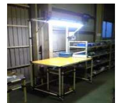
作業台、蛍光灯の置換えに最適