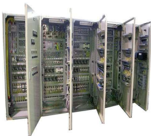
制御盤内、蛍光灯の置換えに最適