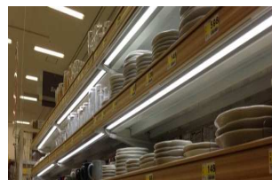
工場在庫置き場等の照明に最適