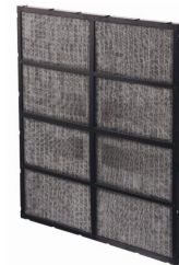
ナノテクプラチナ触媒 + 洗える特殊活性炭フィルター