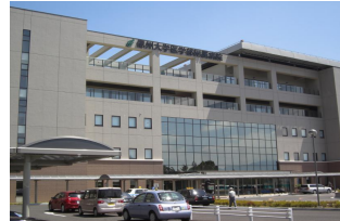
信州大学医学部付属病院

山王病院 日本医科大学付属病院 虎の門病院 兵庫県立こども病院 京都府立大学附属病院 東京慈恵会医科大学付属病院 手稲溪仁会病院 大阪府立成人病センター他