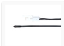
エアコン用コイルタイプ