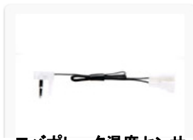
エバポレータ温度センサ (フィンタイプ)