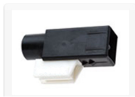
車室内温度センサ