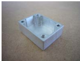
アルミ・鉄・ベーク