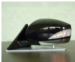
クロームメッキ+塗装