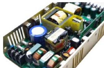
スイッチング電源 30W~250W