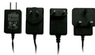
Wall-Mount タイプ 5W~24W