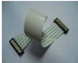
FFCケーブル(インピーダンスFFC等)